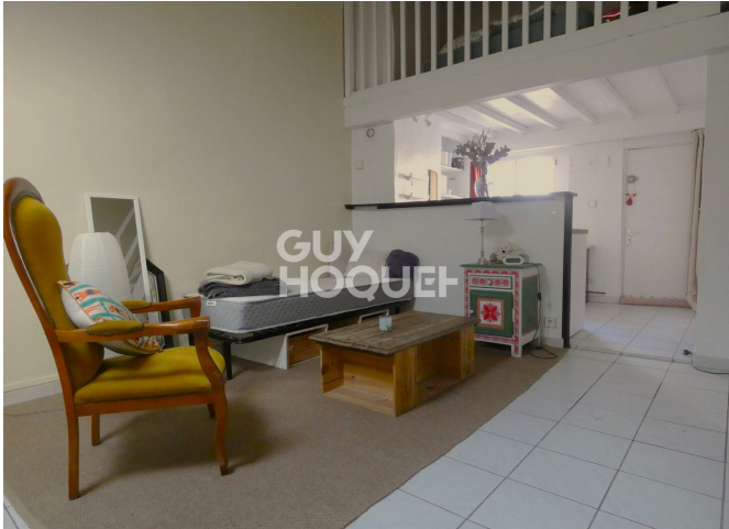
Photo du bien