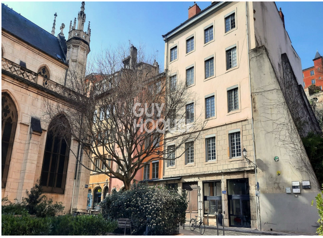
Photo du bien